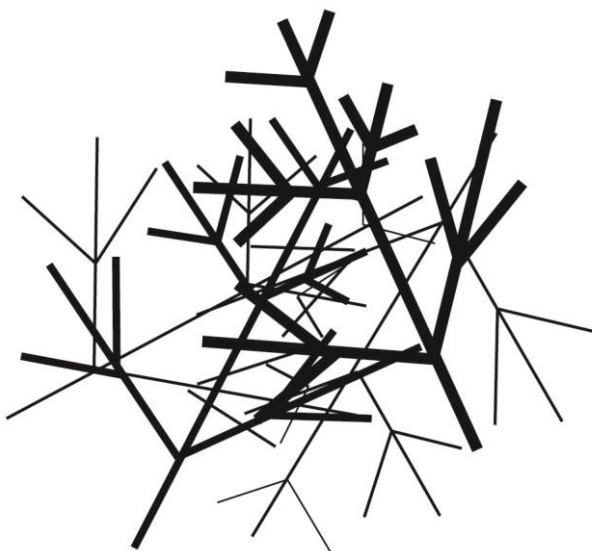
Рис. 1. Топология современных европейских языков

В [1] нами было показано, что структура нейронных цепочек головного мозга человека однозначно определяется топологией того языка, на котором он разговаривает. И там же были приведены обобщённые сведения, которые показывают, что топология всех нынешних языков подобна куче хвороста (рис. 1). В соответствии с современными научными представлениями о работе мозга, при запоминании ребёнком или взрослым человеком любого зрительного образа некоторое количество нейронов правого полушария образуют соответствующую этому образу резонансную структуру рис. 2 [1, 5, 6]. В свою очередь, слуховой образ – имя-название этого предмета образует соответствующую нейронную структуру в левом полушарии мозга. Обе одноимённые структуры двух полушарий мозга связаны между собой мозолистым телом, поэтому увидев знакомый зрительный образ, человек может назвать его имя. И наоборот, услышав название-имя знакомого предмета, человек может представить в своём воображении его зрительный образ. Наличие описанной нейронной связи обеспечивает процессы понимания и мышления с физиологической точки зрения.